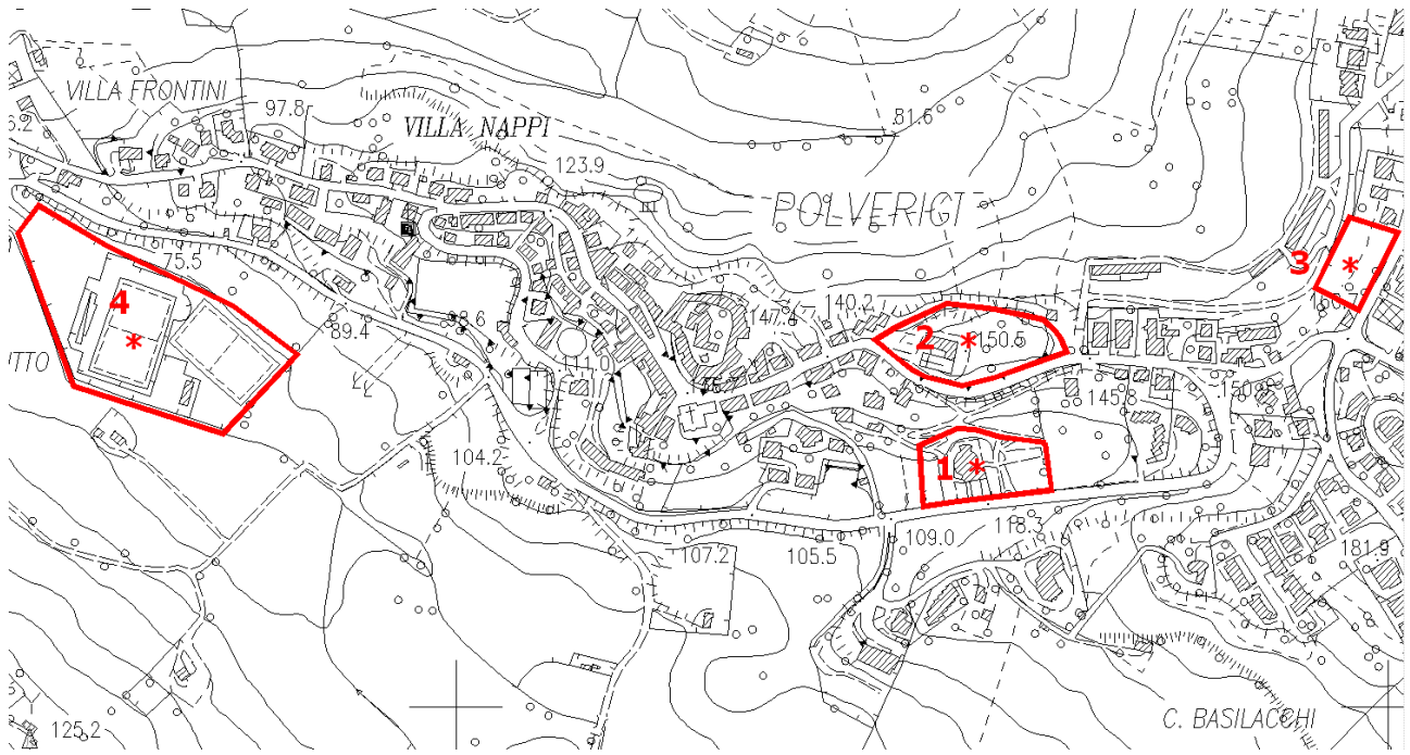
Fig. 1.1 Aree a manifestazione temporanea n° 1, 2, 3 e 4 – Polverigi